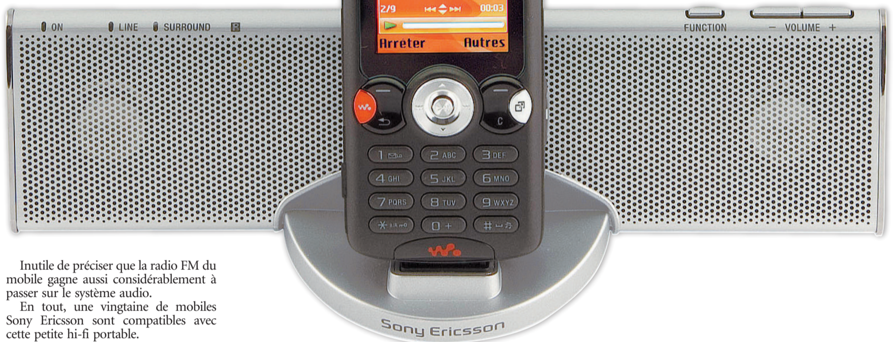
SYSTÈME AUDIO MDS-70 La musique du W810 prend une dimension hi-fi dans les haut-parleurs du Toblerone argenté.